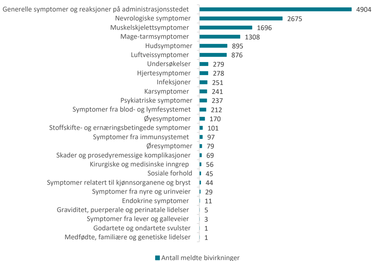
Figur 1: Meldte mistenkte bivirkninger fordelt etter kategori for mRNA-vaksiner (Comirnaty og COVID-19 Vaccine Moderna)

De hyppigst meldte symptomene etter mRNA-vaksinene er hovedsakelig kjente bivirkninger innenfor kategorien generelle symptomer, som dekker reaksjoner på injeksjonsstedet, nedsatt allmenntilstand, feber og generell sykdomsfølelse. Hodepine, svimmelhet og søvnighet etter vaksinasjon er også hyppig meldt, i tillegg til mage-tarmsymptomer som diaré, kvalme og oppkast. Symptomene er oppstått i løpet av 1-2 dager etter vaksinasjon, og er som regel gått over i løpet av noen få dager. Det er mottatt noen meldinger der pasienten har opplevd infeksjoner som lungebetennelse og influensa. Da mRNA-vaksinene ikke er levende kan de ikke forårsake sykdommen det vaksineres mot eller andre infeksjoner.